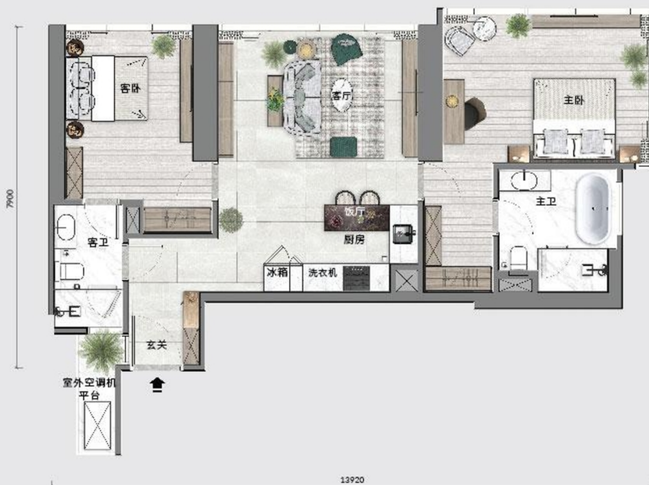
B 4 户型 94 平米 / 1,011 平方尺 塔一