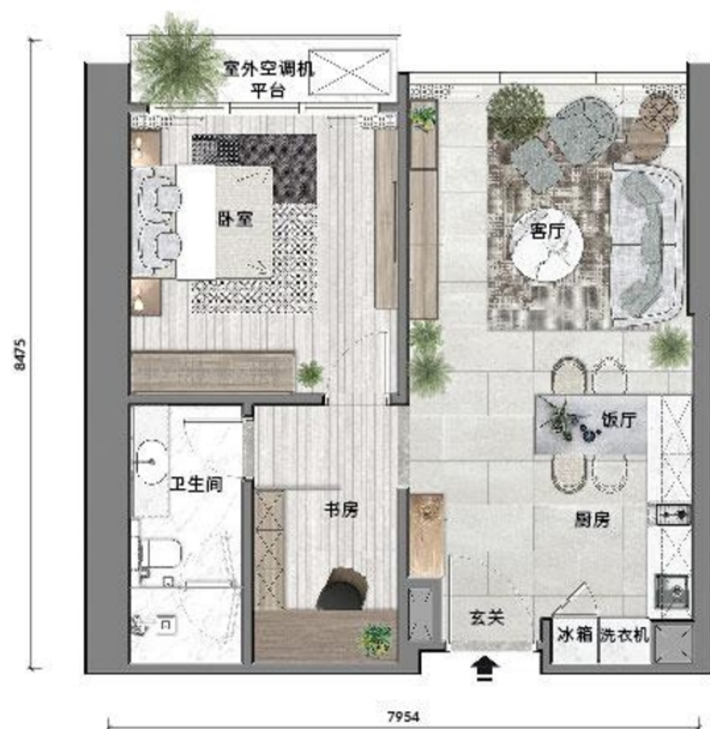
A2 户型 64 平米 / 688 平尺 塔二