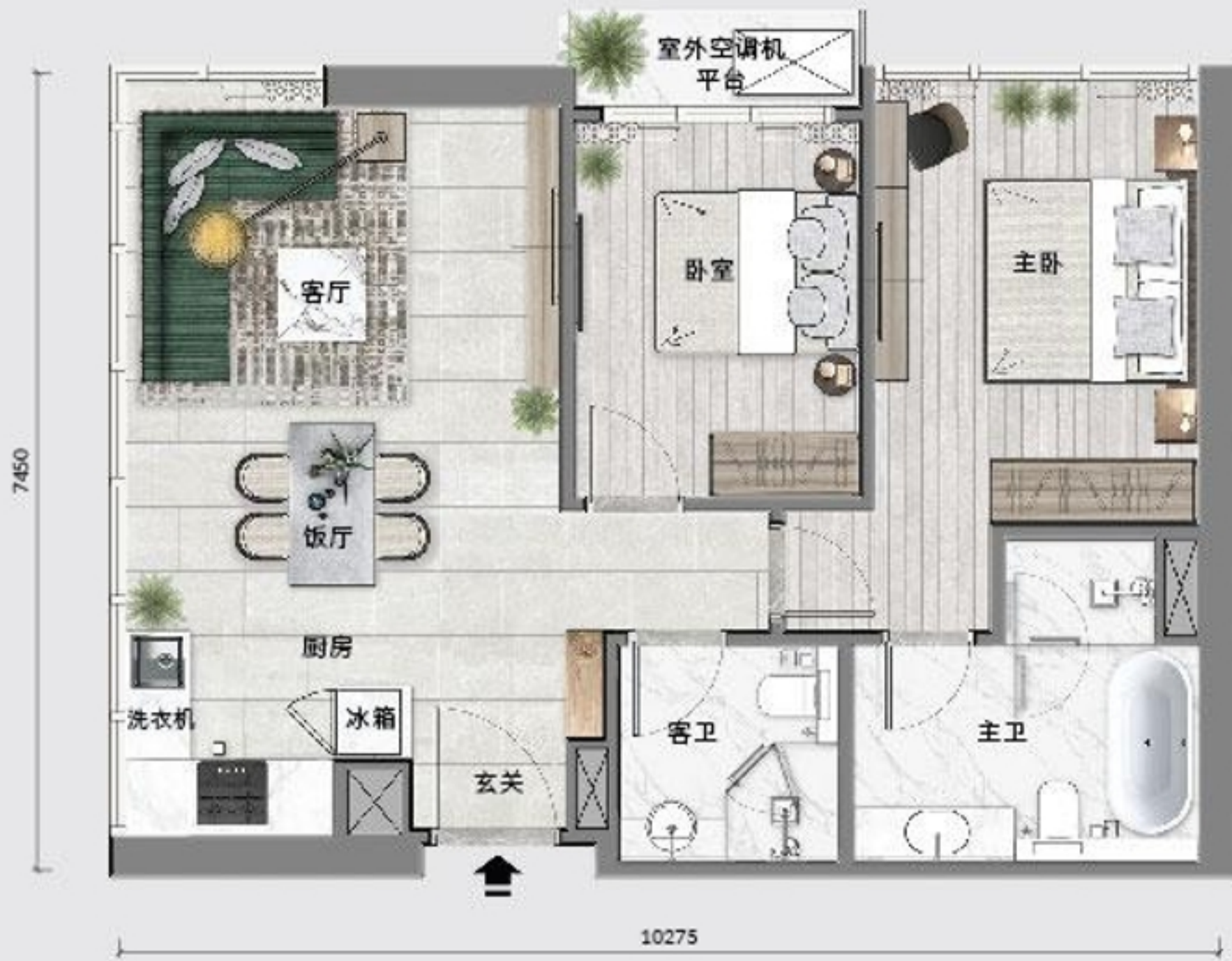
B 2 户型 78 平米 / 839 平方尺 塔二