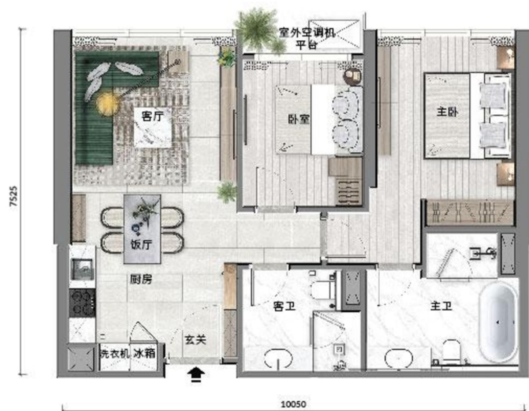
B1 户型 76 平米 / 817 平尺 塔二