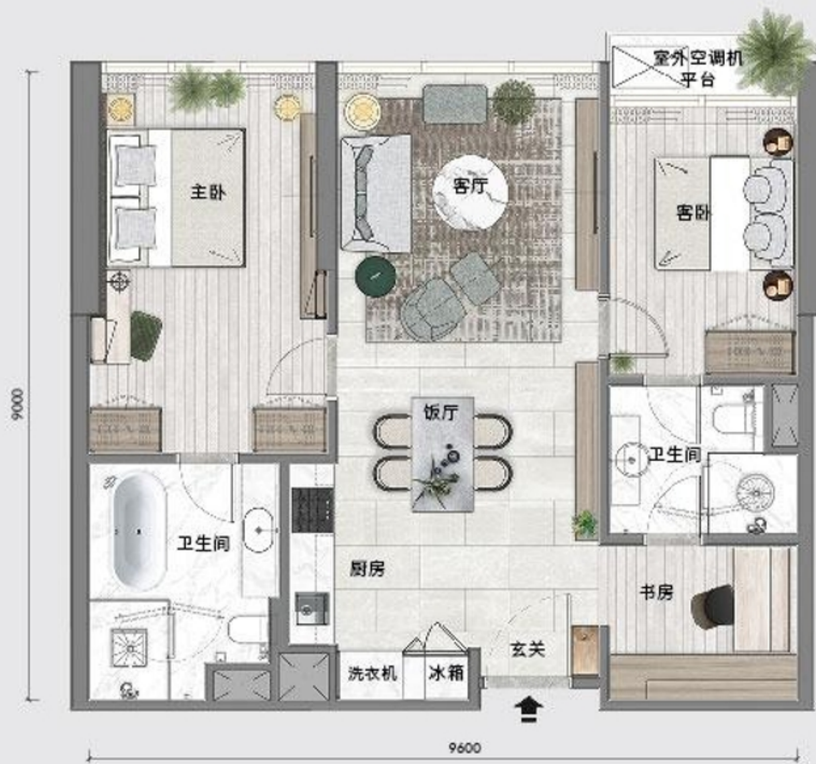
B 3 户型 86 平米 / 925 平方尺 塔一