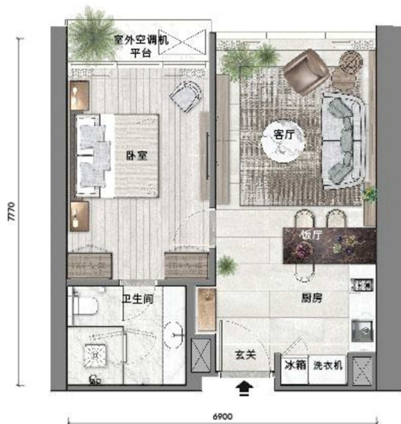
A1 户型 58 平米 / 624 平尺 塔一和塔二